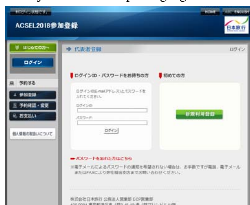
日本語ログイン画面